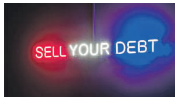
Het Parijse collectief Claire Fontaine stelt met de neoninstallatie Sell your debt het economische systeem waarin schuldenhandelswaar is aan de kaak.

genstromen in Europa sinds de jaren tachtig. Het ziet er prachtig uit, maar het maakt je ook bewust dat die stromen steeds meer en meer worden. Op een ander scherm zie je de laatste technologie op het gebied van archeologie, waardoor je niet meer in de grond hoeft te graven. Er is een scan van een gebied in Bosnië. Het ziet er ‘wow’ uit, maar ondertussen stuit men op menselijke resten in de grond. Die tegenstelling van indrukwekkende technologieën en confronterende beelden komen regelmatig terug in Hacking Habitat .”