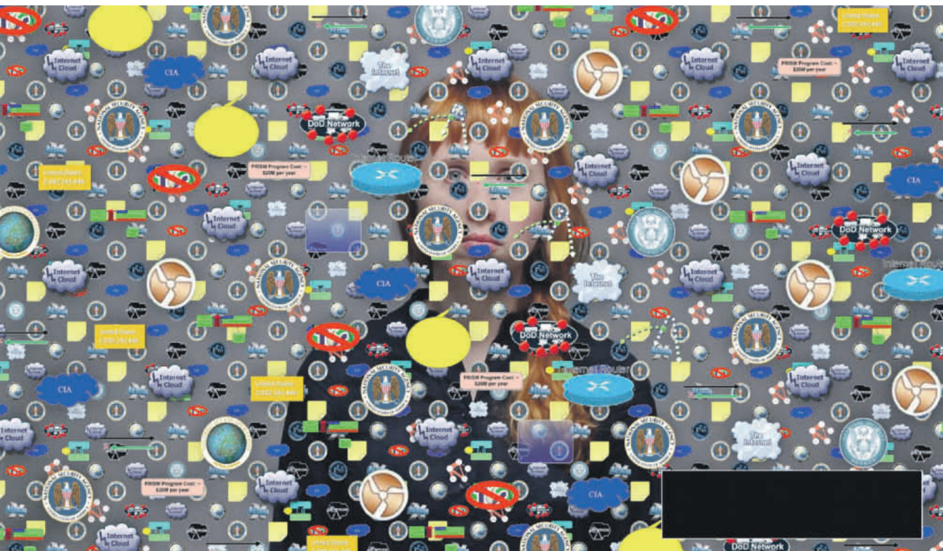
Het Nederlandse designduo Metahaven werkte mee aan de videoclip Home , waarbij zangeres Holly Herndon in een douche van merknamen staat.